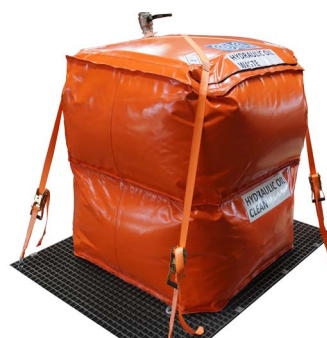
▲ Ein Beispiel für eine Tanklösung an der SOCOTFlex®-Einheit