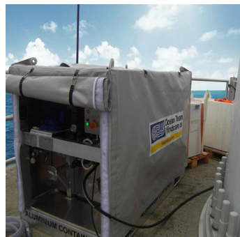
▲ Die SOCOTFlex®-Lösung auf einer Monopile-Plattform

Das OTW-Team liefert gern ein schlüsselfertiges Projekt, das anderen Zielen vor Ort dient. Es besteht für den Kunden außerdem die Möglichkeit, die Ölumwandlung von seinen eigenen Mitarbeitern oder seinem hauseigenen Dienstleistungsunternehmen durchführen zu lassen.